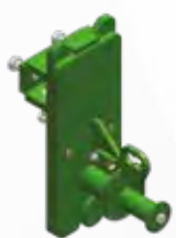
Attelage automatique Automatic coupling device