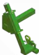
Attelage automatique combiné (+ option sécurité) Combined and automatic coupling device (+safety feature)