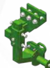
Attelage montage combiné Combined assembly coupling device