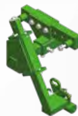
Attelage montage P.O. à colonne Tool holder coupling device