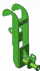
Attelage automatique (commun avec broyeur Vit'Europ BSR600) Automatic coupling device (usable for the BSR shredder)